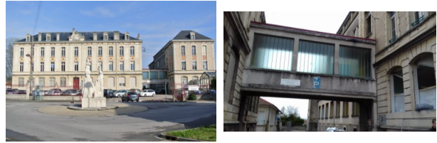
Vue des bâtiments avant travaux

pérennisant sa structure et en permettant un accès de plain-pied avec un ascenseur intérieur.