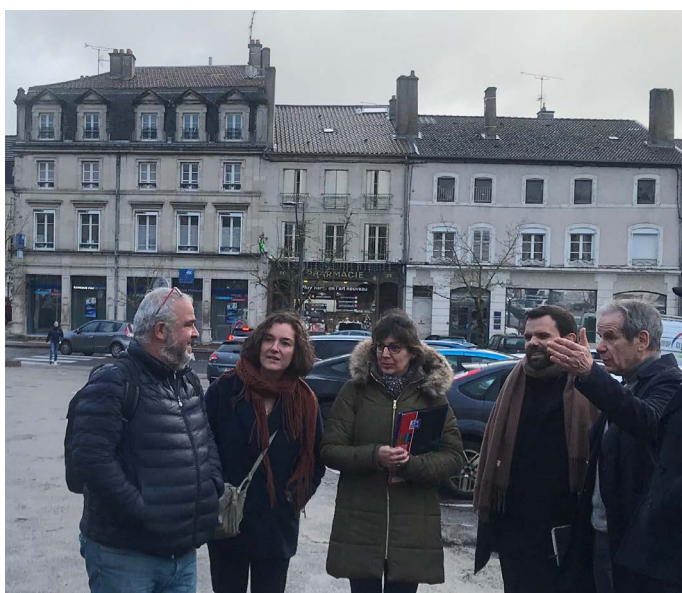
Visite sur site réalisée avec Les Marneurs, Blesch Cayre Architectes, Concept Infra et la Ville, le 13 décembre 2023.

Depuis décembre, ce groupement travaille donc à l'élaboration technique et opérationnelle du chantier. Après diverses études opérationnelles, ils vont prochainement aller à la rencontre des professionnels se situant sur la place, et dévoileront une esquisse visant à établir des propositions imaginées sur la base du programme (rappel des points forts du programme en dernière page). Pour ensuite proposer un avant projet donnant la dimension de la restructuration de la place dans ses grandes lignes avec un coût prévisionnel par lot.