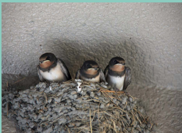
Nids d'Hirondelles présents sur le site à déplacer avant la démolition et à réimplanter dans un périmètre de 200m.

Les inspections du bâtiment ont également permis de découvrir la présence de nids d'hirondelles sur la structure. La DREAL est donc intervenue au travers de la police de l'environnement pour constater la présence des nids. Une procédure dérogatoire a été engagée par la Mairie afin que nous puissions obtenir l'autorisation de déplacer ces nids. Dans l'intérêt de la protection de l'espèce, ils seront ainsi réimplantés dans un périmètre de 200 mètres conformément à la réglementation.